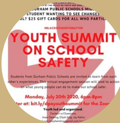
CUMBRE DE JÓVENES SOBRE SEGURIDAD ESCOLAR