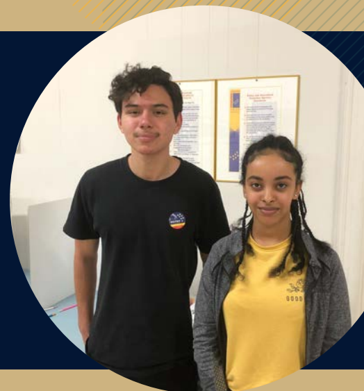
Miembros de la Comisión de Jóvenes de Durham 2019-2020 (antes de COVID-19)

Un valor fundamental en nuestra oficina es que la participación auténtica de los jóvenes es clave para crear comunidades sostenibles y prósperas. Creemos que los jóvenes deben tener voz en las decisiones que les afectan a ellos y a sus comunidades. Así que este año ampliamos nuestra consulta y colaboración con los departamentos de la ciudad y el condado para apoyarles en crear oportunidades para que los jóvenes compartan el poder y la toma de decisiones.