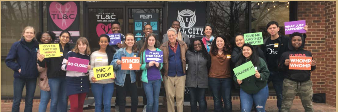
Comisión de Jóvenes de Durham y Funcionaries Electes – Retiro Anual, diciembre de 2019