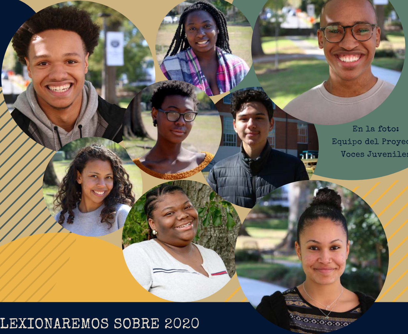
En la foto: Equipo del Proyecto Voces Juveniles