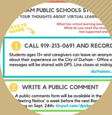
LÍNEA DE MENSAJES DE APRENDIZAJE VIRTUAL