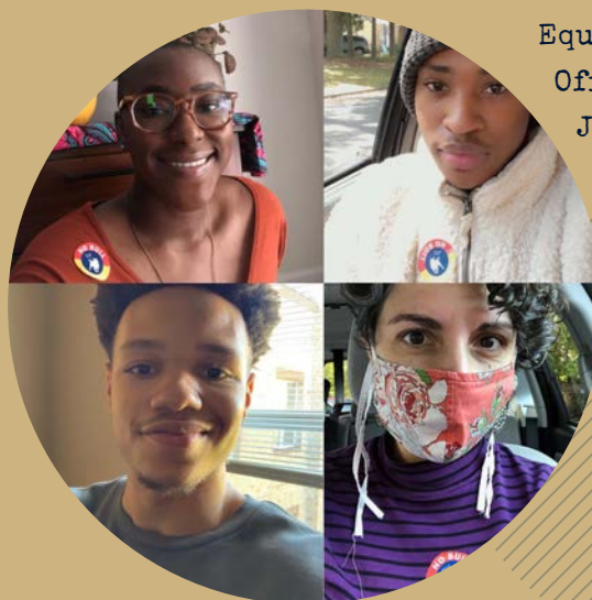
Equipo de la Oficina de Jóvenes

"¿Qué es algo que te hizo reír esta semana?"