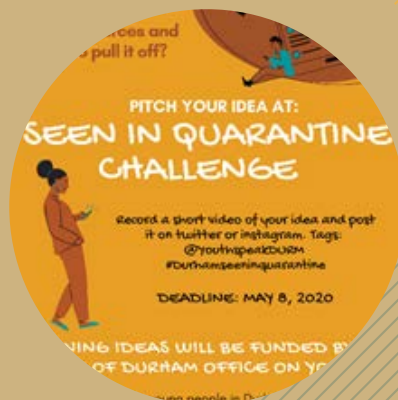
EL DESAFÍO "SEEN IN QUARANTINE"