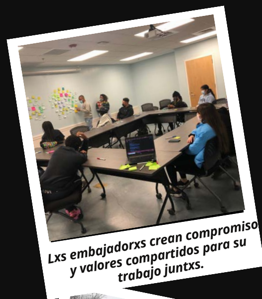
Lxs embajadorxs crean compromiso y valores compartidos para su trabajo juntxs.

Seguiremos reuniéndonos con lxs embajadorxs durante todo el año y estaremos participando en capacitaciones, conversaciones, proyectos y otras oportunidades para ser sensibles a las necesidades de nuestra comunidad de Durham. ¡Estamos muy entusiasmadxs de ver lo que tiene que ofrecer el 2022 para lxs Embajadorxs Changed by Youth!