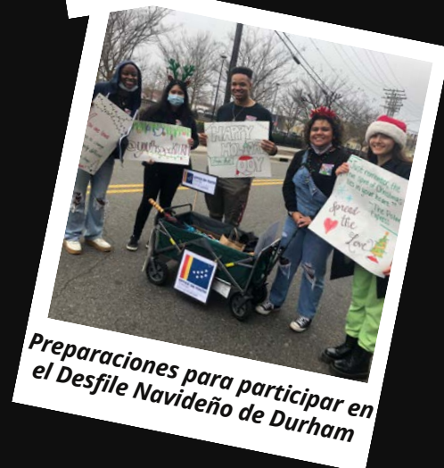
Preparaciones para participar en el Desfile Navideño de Durham