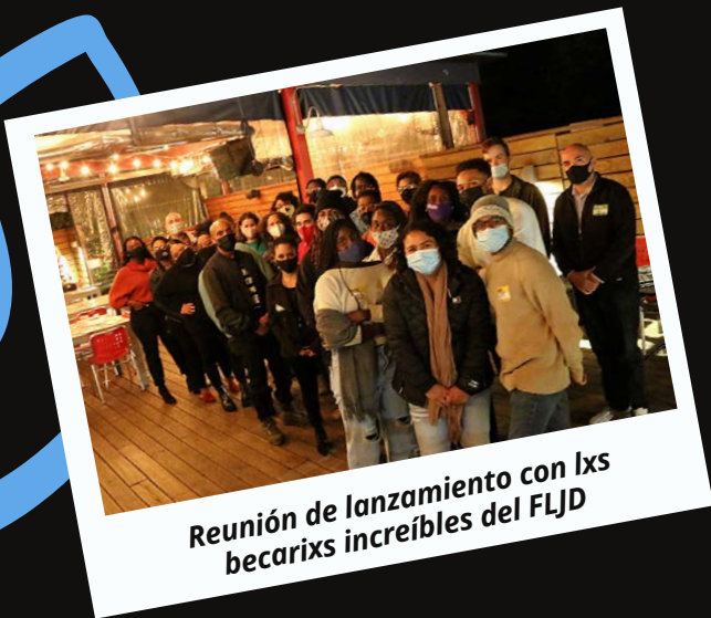
Reunión de lanzamiento con lxs becarixs increíbles del FLJD

Con el apoyo financiero del Programa de Financiamiento para Organizaciones sin Fines de Lucro del Condado de Durham, lanzamos el Fondo de Liderazgo Juvenil de Durham (FLJD) en la primavera de 2021 para ayudar a impulsar las prioridades del Proyecto Voces Juveniles.